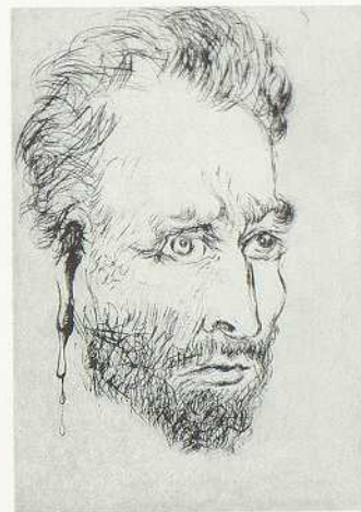
Van Gogh, 1968 Aus der Folge «15 Radierungen» Radierung und Kaltnadel 17,5×12,5 cm 44,7×31,2 cm Bez. u. l.: 66/75, u. r.: Dalí Sahli 84b; Michler/Löpsinger 288 Geschenk der Galerie Albert K. Haas, Vaduz LSK 69.56