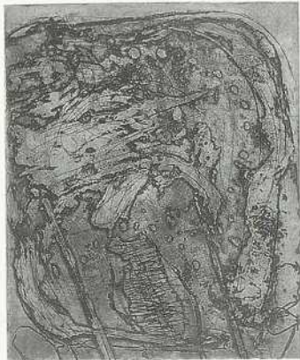
Ohne Titel Farbradierung 34×30 cm 70×50,5 cm Bez. u. l.: 40/50, u. r.: Dahmen LSK 82.17