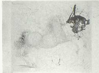
Pégasus, 1963 Aus der Folge «Mythologie» Farbradierung und Farblithographie 53,5×62 cm 56,5×76,4 cm Bez. u. l.: I/XX, u. r.: Dalí 63 Michler/Löpsinger 128 LSK 71.18

Ab 1916 Zeichenunterricht in Figueras, wo er 1919–21 als Illustrator tätig ist. 1921–26 Studium an der Kunstakademie in Madrid; Freundschaft mit Lorca und Buñuel. 1927/28 Reisen nach Paris, wo er Picasso und Breton begegnet. 1929 Mitarbeit am Film Un Chien Andalou und 1931 L'Age d'Or von Buñuel. 1930–40 in Paris; Bekanntschaft u. a. mit Miró, Max Ernst und Masson; gehört bis 1934 der Gruppe der Surrealisten an. Mit seinen in betont veristischer Malweise gestalteten Motiven aus den Bereichen des Absurden, Unbewussten, der Sexualität oder Religiosität wird er einer der bedeutendsten Vertreter des Surrealismus. 1938 Ausschluss aus der surrealistischen Bewegung; lernt in London Sigmund Freud kennen. 1940 Übersiedlung nach Pebble Beach, California; sein Werk beginnt zunehmend seinen kultartig exzentrischen Selbstbezug zu widerspiegeln. Lebt seit 1948 in Port-Lligat in Spanien; malt erste rein religiöse Bilder. Grosse Retrospektiven 1964 in Tokio, 1966 New York und 1970 Rotterdam. 1972 Eröffnung des Dalí-Museums in Figueras.