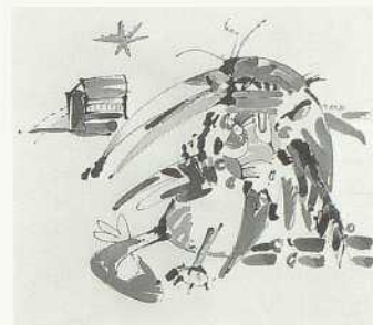
Die Krähe, 1984 Tusche, Acryl, Farbstift, collagiert 39×44,5 cm Bez. o. r. (Feder in Schwarz): O. Alt 84 LSK 89.03