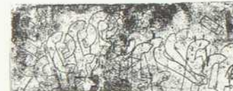
Ohne Titel Radierung mit Schablonen 19,5×49,9 cm 45,5×63,4 cm Bez. u. l.: 17/50, u. r.: R Altmann LSK 78.01.10