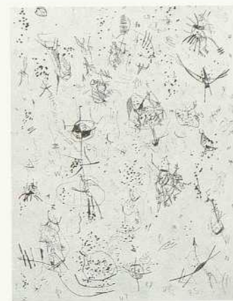
Ohne Titel Kaltadel 39,5×29,7 cm 56,9×38 cm Bez. u. r.: 12/12 R Altmann LSK 78.01.06