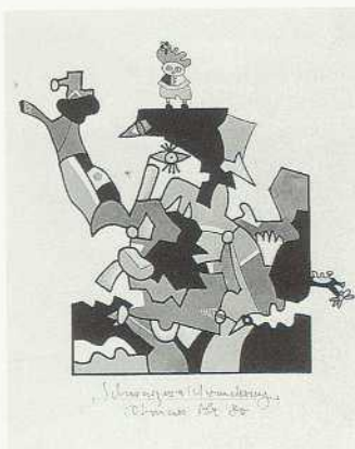
Schwarzwaldwanderung, 1980 Gouache, Deckfarben und Farbstifte 39,1×32 cm Bez. u. M. (Feder in Dunkelbraun): Schwarzwaldwanderung Otmar Alt 80 LSK 81.06