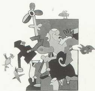
Gutes Flugwetter, 1979 Deckfarben und Farbstifte 39,2×32,1 cm Bez. u. M.: Gutes Flugwetter Otmar Alt 79 LSK 81.05