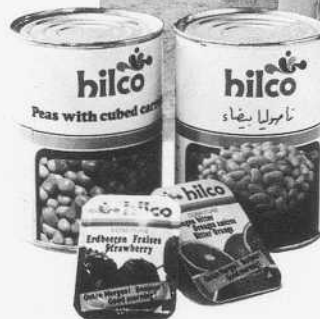
Exportleiter auf Nahostreise.