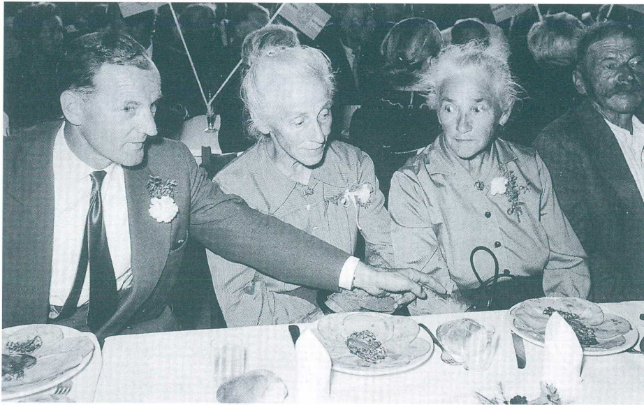
Die BALZERS AG (damals Gerätebau-Anstalt) unterstützte die Aktion nicht nur finanziell. Die Mitglieder der Geschäftsleitung waren als Chauffeure aktiv beteiligt. Der Ausflug wurde damals mit Privatautos durchgeführt.