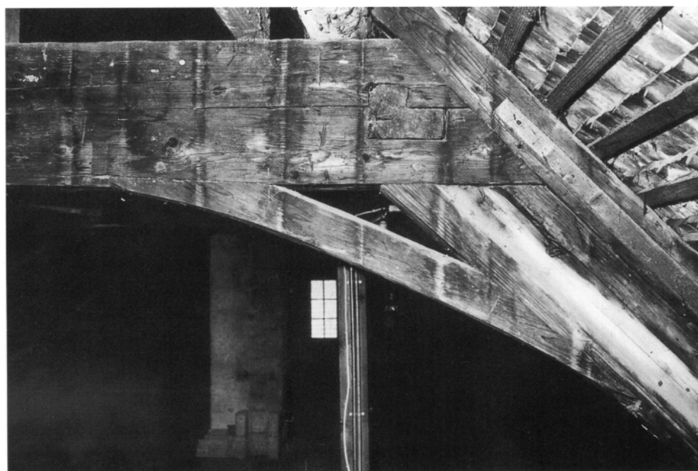
Abb. 10: Wohnhaus-Dachstuhl von 1827d; nördliche Dachfläche mit Windverband über dem Küchenteil.