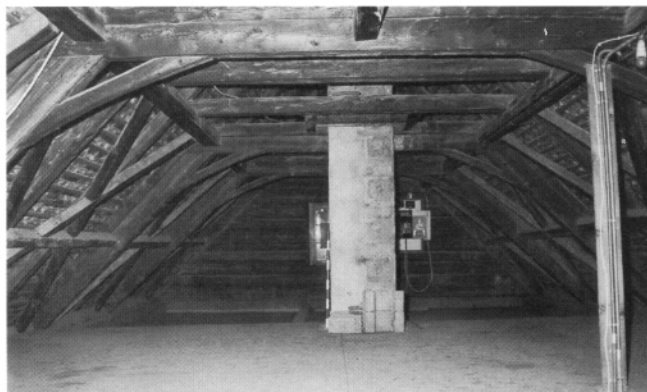
Abb. 8: Wohnhaus-Dachstuhl, 1827 d als liegende Konstruktion errichtet; Osteinsicht.