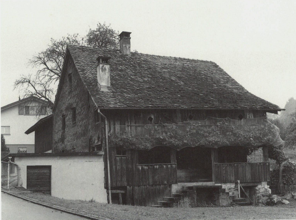
Abb. 17: Westansicht