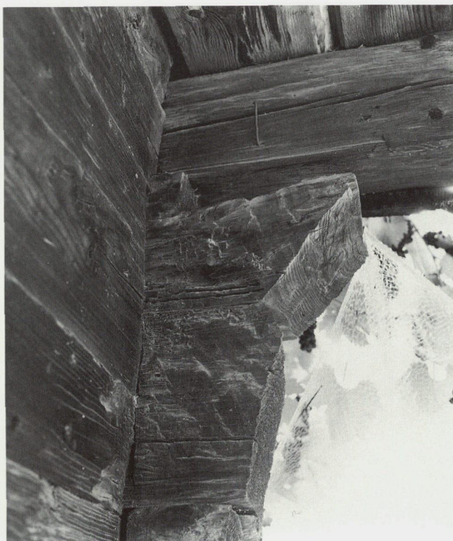
Abb. 19: Südecke des Hauses; der oberste Gwettkopf des Erdgeschosses stösst weiter vor und zeigt einen Versatz zum Einhängen des Laubengebälkes.