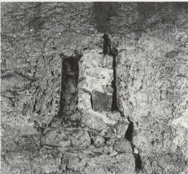
Abb. 26: Nordwestfassade von 1494 mit Fenster- chen e, 50 × 60 cm, nach Bruch des Sturzsteines auf 15 × 60 cm verengt