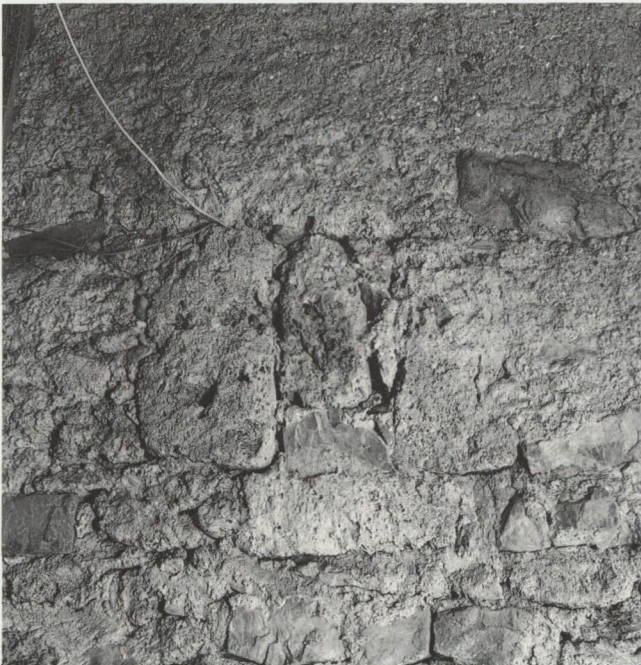
Abb. 25: Nordwestfassade von 1494 mit Licht- schlitz d, 25 × 65 cm