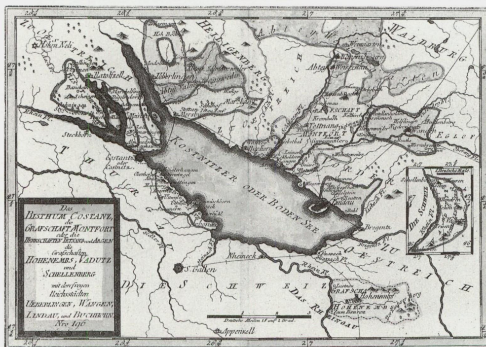
Abb. 14: Das Bisthum Constanz . . . die Grafschaften Hohenembs, Vadutz und Schellenberg . . . Kupferstichkarte von Franz Johann Josef von Reilly, Wien 1789