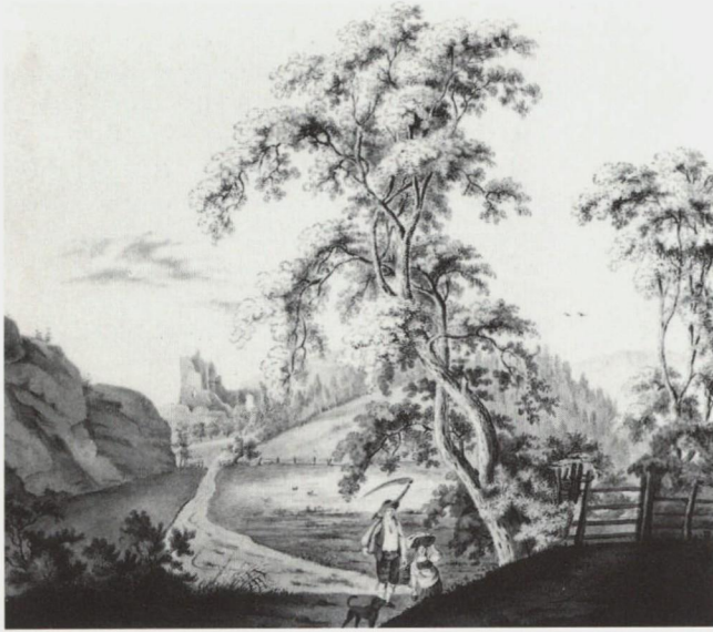
Abb. 9: Ruine Schellenberg. Obere Burg. Lavierte Federzeichnung von August Kayser, Bregenz 1813–1874