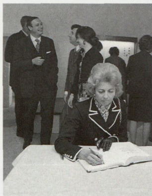
Abb. 3 und 4: Als am 15. April 1972 das Liechtensteinische Landesmuseum im ehemaligen Amtshaus in Vaduz eröffnet wurde, waren S. D. Fürst Franz Josef II. und I. D. Fürstin Gina die ersten, die sich in das Gästebuch eingetragen haben.