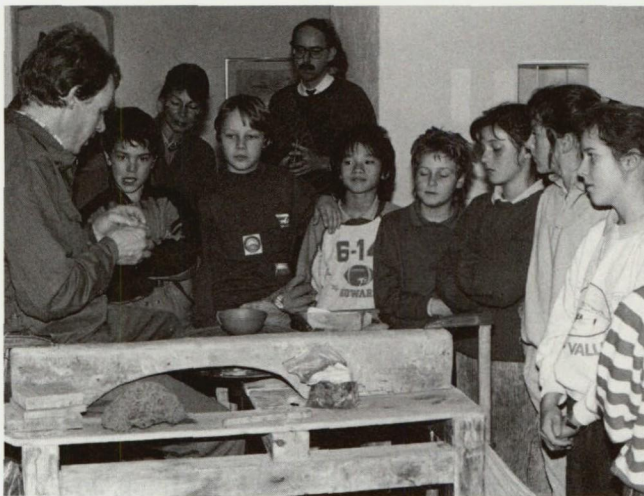
Abb. 2: Terra Sigillata – Römisches Tafelgeschirr in Archäologie, Herstellung und Gebrauch. Blick in die Sonderausstellung in der archäologischen Abteilung des Liechtensteinischen Landesmuseums.