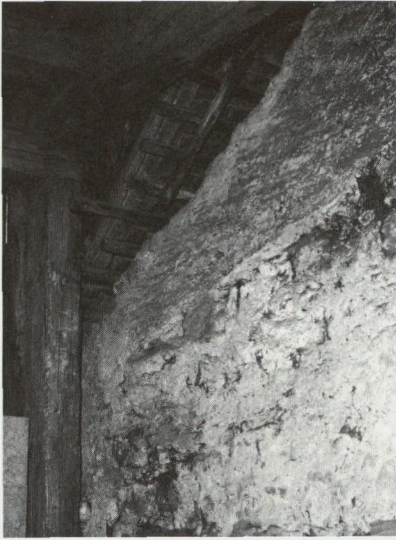
Abb. 24: Wohnhaus-Ostfassade, mit der Dachschräge einer älteren Scheune.