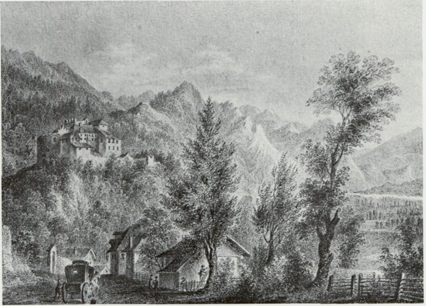
Schloss Vaduz 1828. Zeichnung von I. v. Isser