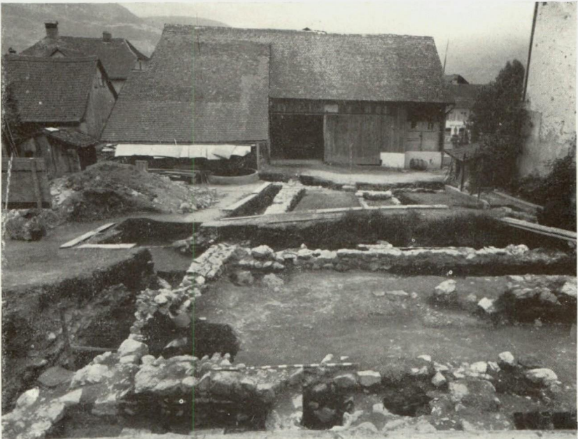
Abb. 30. Blick v. Bad aus geg. Westen, Fundamente d. Mannschaftsräume