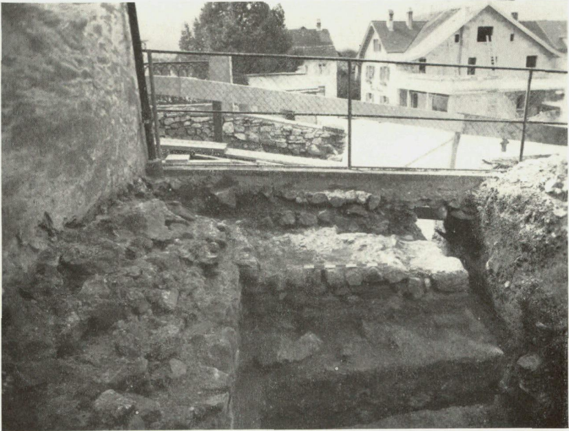
Abb. 24. Ecke des Torturms an der NW-Ecke der Kirche (Schnitt 2)