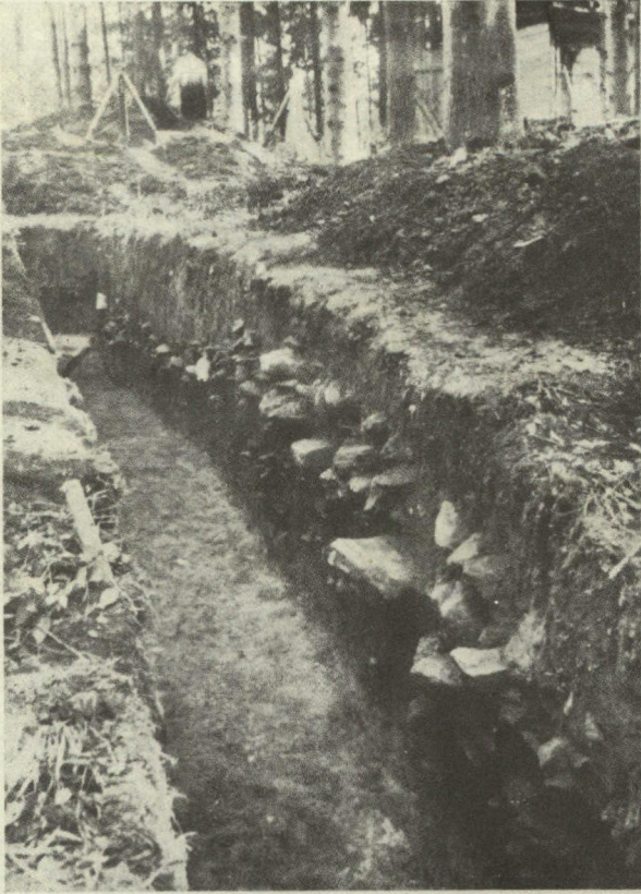
Abb. 5. Schnitt 11 gegen das Platzinnere (Vergl. Profil 2)