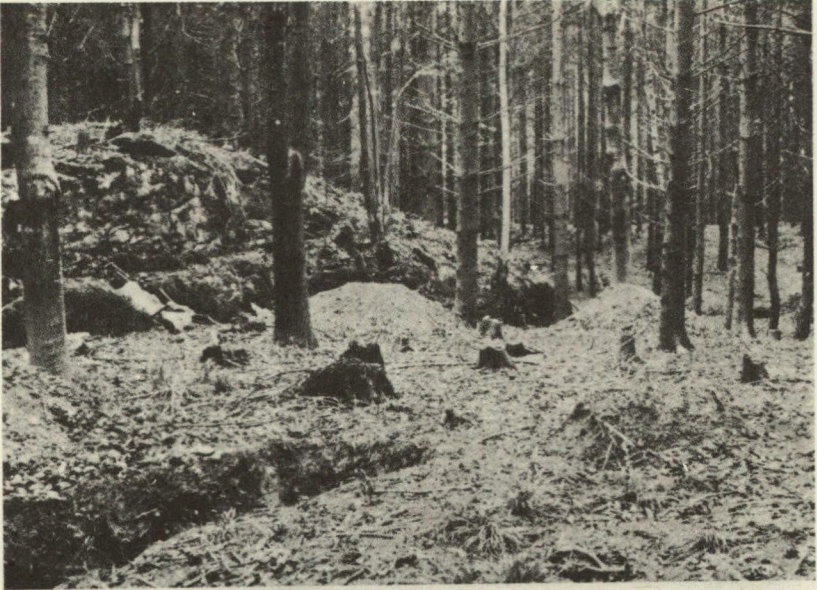
Abb. 1. Malanser, Grabungsplatz, Blick gegen S-W. (Aufnahme 1946 von Schnitt 1 aus)