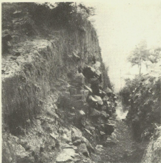
Abb. 13. Der Wallschnitt 10 - Blick nach aussen (geg. Süden).