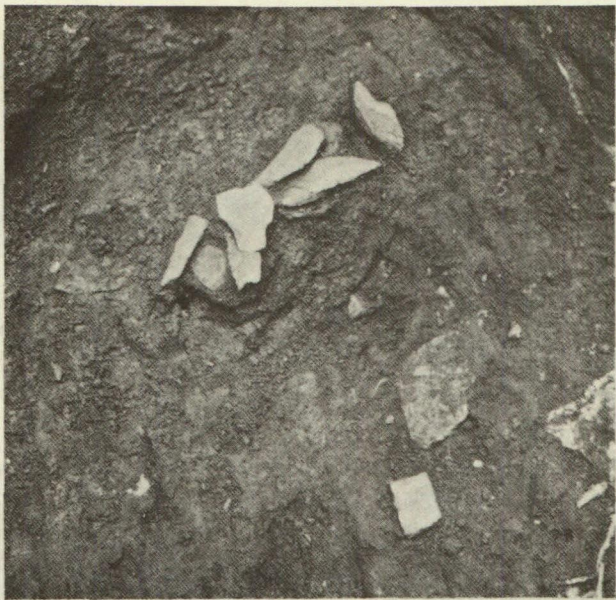
Abb. 15. Feuersteingeräte in der Horgener Schicht.