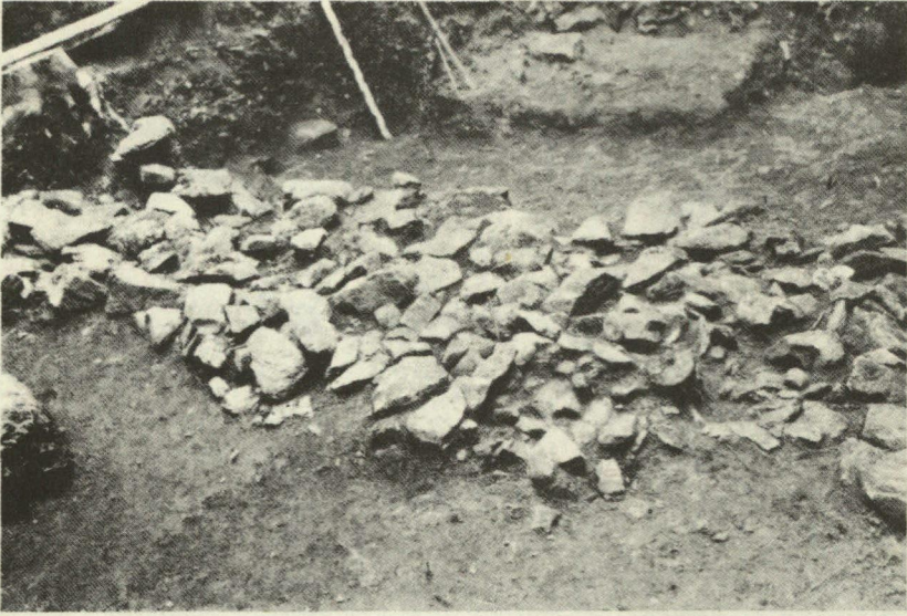
Abb. 12. Verstärzte Steinmauer in der eisenzeitlichen Schicht. Ansicht v. Südwesten.