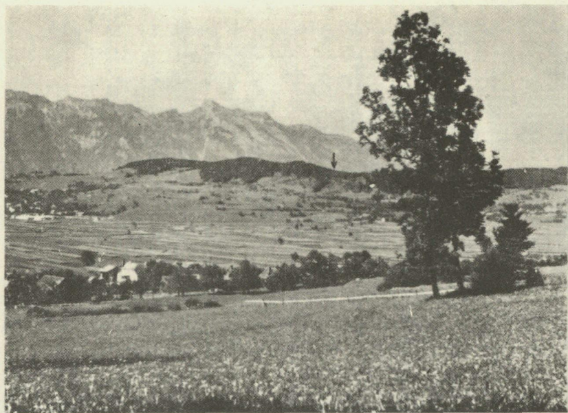
Abb. 8. Lage des Lutzengütle auf dem Eschner Berg. Ansicht von Südosten.