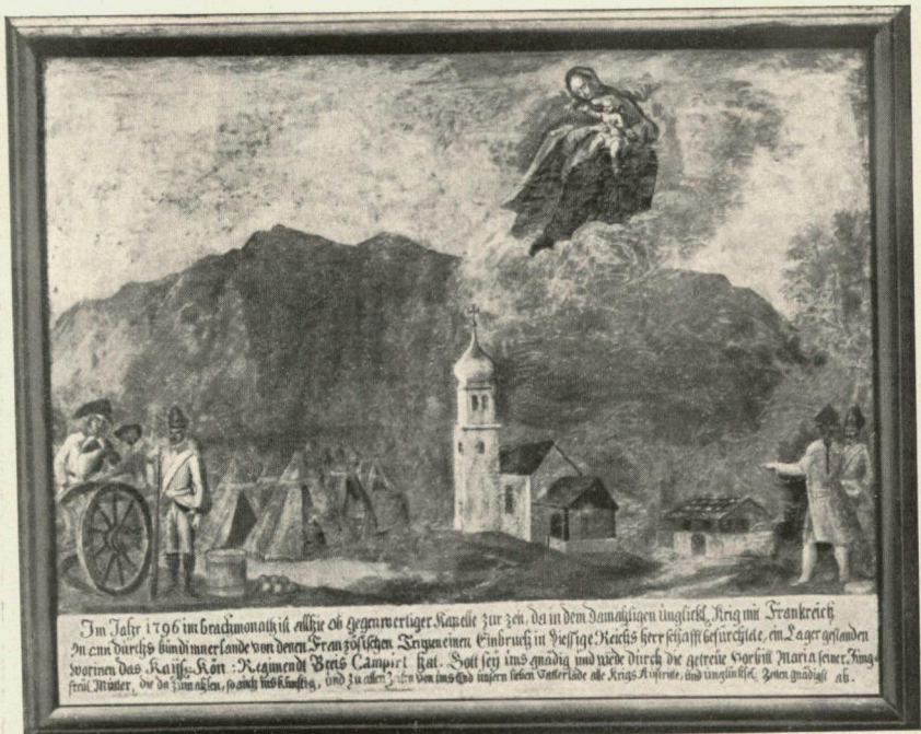
Das österreichische Lager von 1799. Nach einem Gemälde.